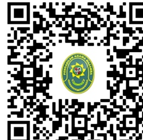
45. LAPORAN PENGEMBALIAN SISA PANJAR https://pa-masamba.go.id/index.php/kepaniteraan/laporan-pengembalian-sisa-panjar-perkara