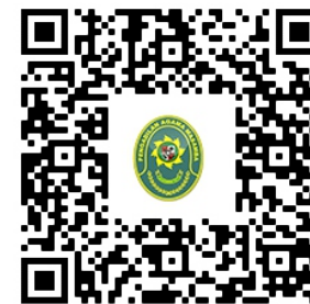
48. PEDOMAN KEPANITERAAN https://pa-masamba.go.id/index.php/kepaniteraan/pedoman-pengelolaan-kepaniteraan